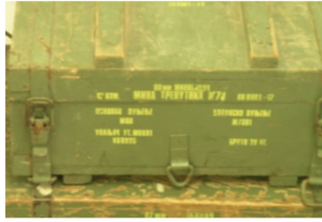
Arms Trade Highlights: September - October 2016