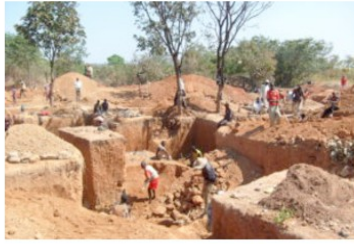
Het conflict in de Centraal-Afrikaanse Republiek in kaart gebracht.