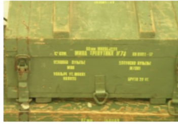
Arms Trade Highlights: September - October 2016