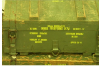
Arms Trade Highlights: September – October 2016