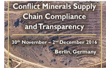
Forum on Conflict Minerals Supply Chain Compliance and Transparency (30 Nov – 2 Dec 2016)