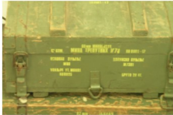
Arms Trade Highlights: September – October 2016