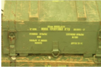
Arms Trade Highlights: September - October 2016