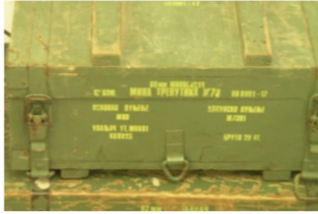
Arms Trade Highlights: September – October 2016