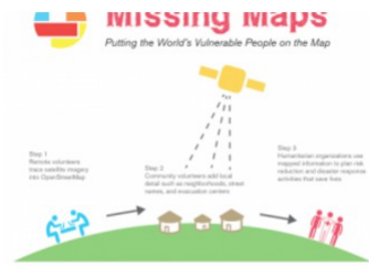
COMING SOON! MISSING MAPS MAPATHON / WEDNESDAY, 26 OCTOBER 2016