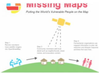
COMING SOON! MISSING MAPS MAPATHON / WEDNESDAY, 26 OCTOBER 2016