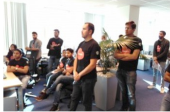
A fresh look at IPIS data during the DataMinds Analytic-A-Thon