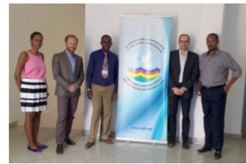
Design of the ICGLR regional database on mineral flows