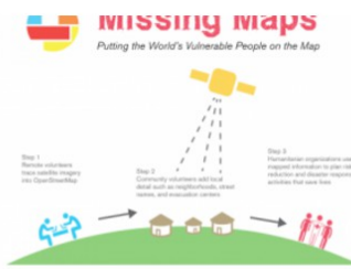
COMING SOON! MISSING MAPS MAPATHON / WEDNESDAY, 26 OCTOBER 2016