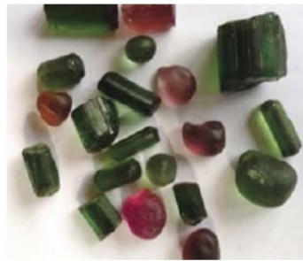
Coloured gemstones in eastern DRC: Tourmaline exploitation and trade in the Kivus