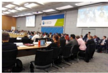
OECD Forum on Responsible Minerals