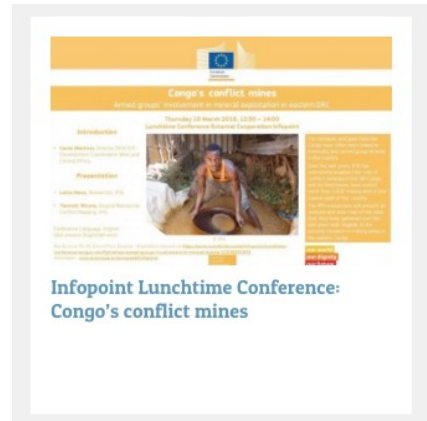
Infopoint Lunchtime Conference: Congo's conflict mines