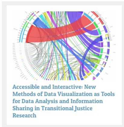
Accessible and Interactive: New Methods of Data Visualization as Tools for Data Analysis and Information Sharing in Transitional Justice Research