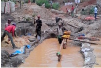
Artisanal Mining Sites in Eastern DRC - Photo Competition