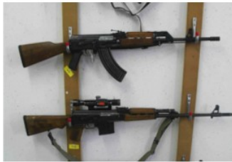
Arms Trade Highlights: October - December 2015