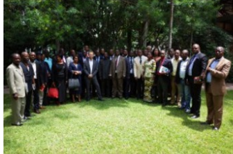
Presentation of SAESSCAM database on Artisanal and Small-scale Mining