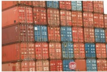
Arms Trade Highlights: August - September 2015