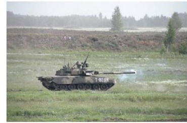
Arms Trade Highlights: June - July 2015