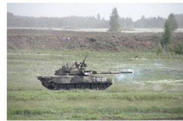
Arms Trade Highlights: June - July 2015