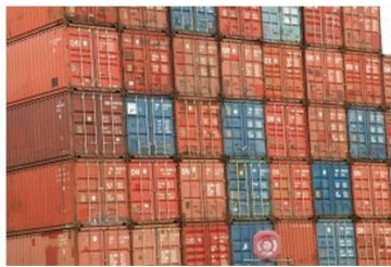
Arms Trade Highlights: August - September 2015