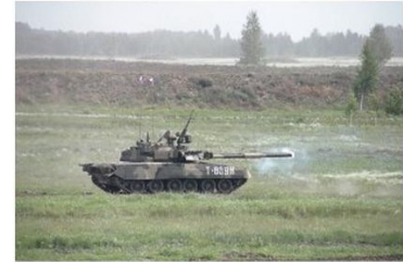
Arms Trade Highlights: June - July 2015