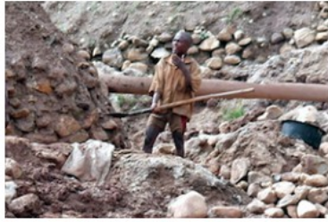
Review of the Burundian Artisanal Gold Mining Sector