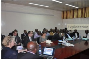
Exploitations artisanales et à petite échelle en RD Congo