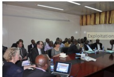
Exploitations artisanales et à petite échelle en RD Congo