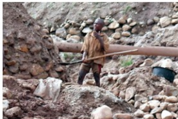
Review of the Burundian Artisanal Gold Mining Sector