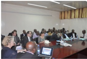
Exploitations artisanales et à petite échelle en RD Congo