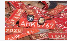
Trafic de voitures