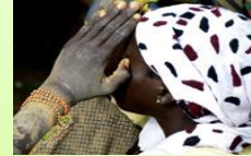
Criminalité contre l'enfant