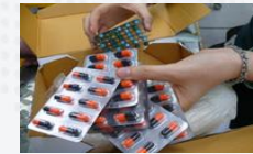
Contrefaçon de médicaments