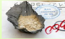
Trafic de stupéfiants