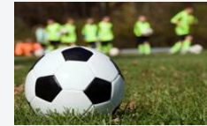
Criminalité dans le sport