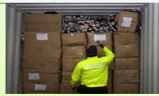
Contrefaçon de biens