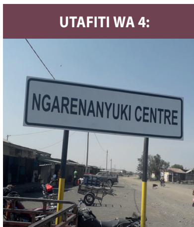
UTAFITI WA 4: