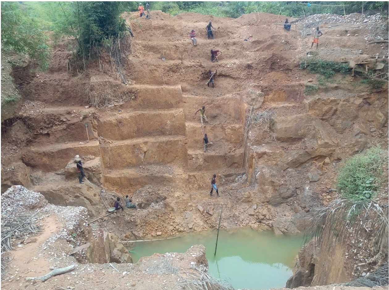
Mine d'or à l'est du Congo

La présente étude, en plus d'être un aide-mémoire de la fiscalité et de la parafiscalité du secteur minier artisanal, met aussi en évidence les faiblesses identifiées dans la perception des taxes et autres droits ainsi que les responsabilités de ces faiblesses. Des interviews menées tout au long de l'étude, et de l'analyse des documents légaux, une problématique s'est dégagée: la différence entre les paiements légaux et les paiements réellement opérés.