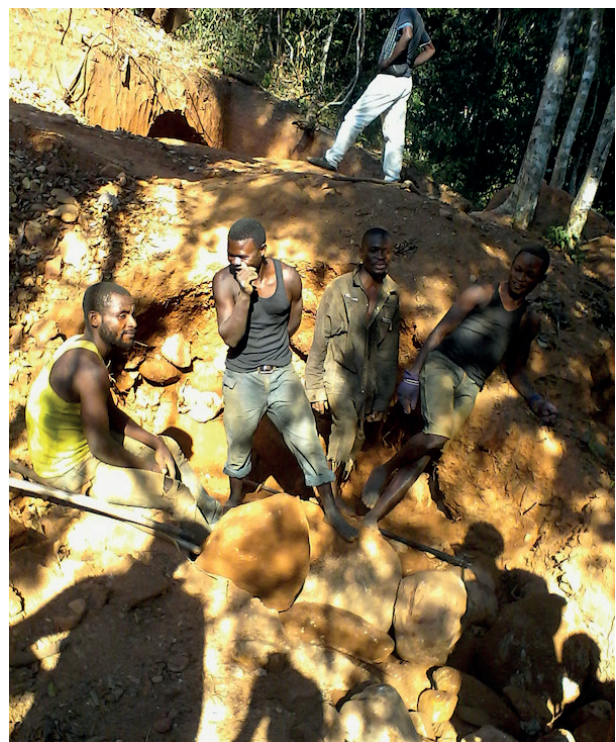
Tumbwe Kalemie homme en travail

L'arrêté provincial N°2013/0050 /Katanga prévoit une taxe d'incitation à la transformation locale des concentrés de 60 $ par tonne. À notre avis, cette taxe n'encourage la transformation au niveau local, au contraire, cela dissuade. Au lieu d'un quelconque paiement pour avoir transformé localement les minerais, on aurait souhaité carrément exonérer les entités qui font la transformation au niveau local, et taxer ceux qui font la concentration hors pays.