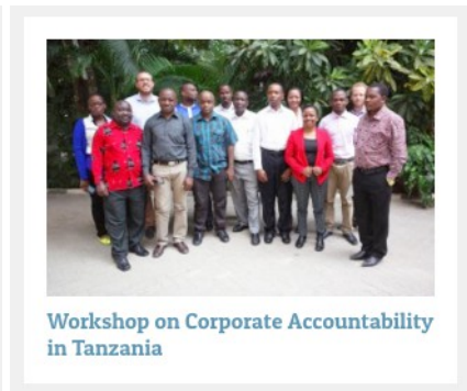
Workshop on Corporate Accountability in Tanzania