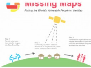
COMING SOON! Missing Maps mapathon / Wednesday, 9 December 2015