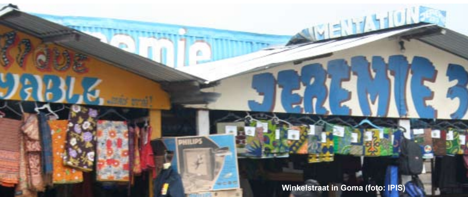
Winkelstraat in Goma

Daarnaast begeleidden we nog twee andere stagiairs die ons bijstonden bij ons lopende onderzoekswerk.