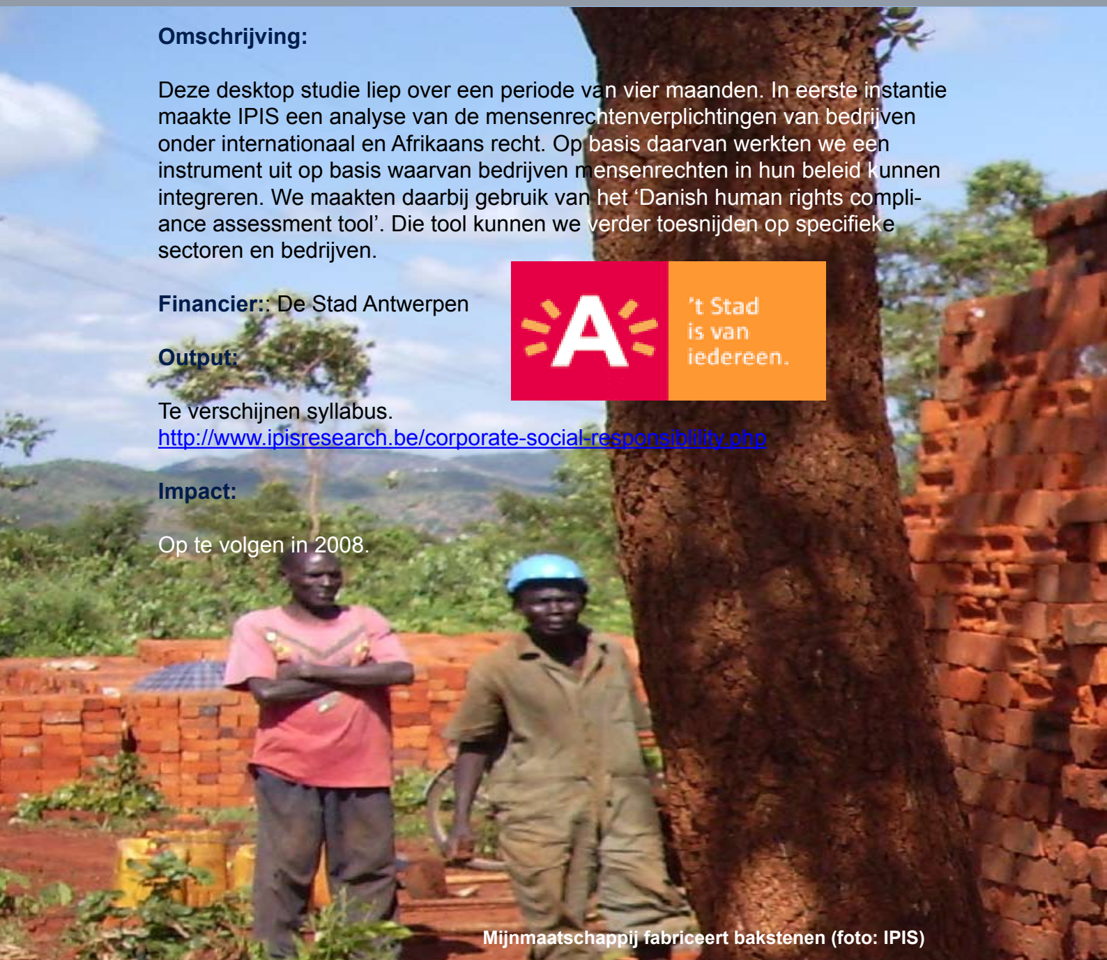
Mijnmaatschappij fabriceert bakstenen