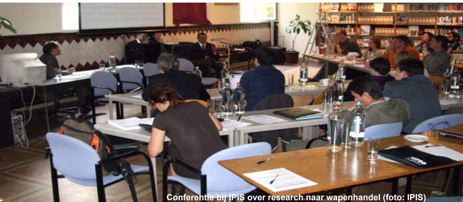
Conferentie bij IPIS over research naar wapenhandel