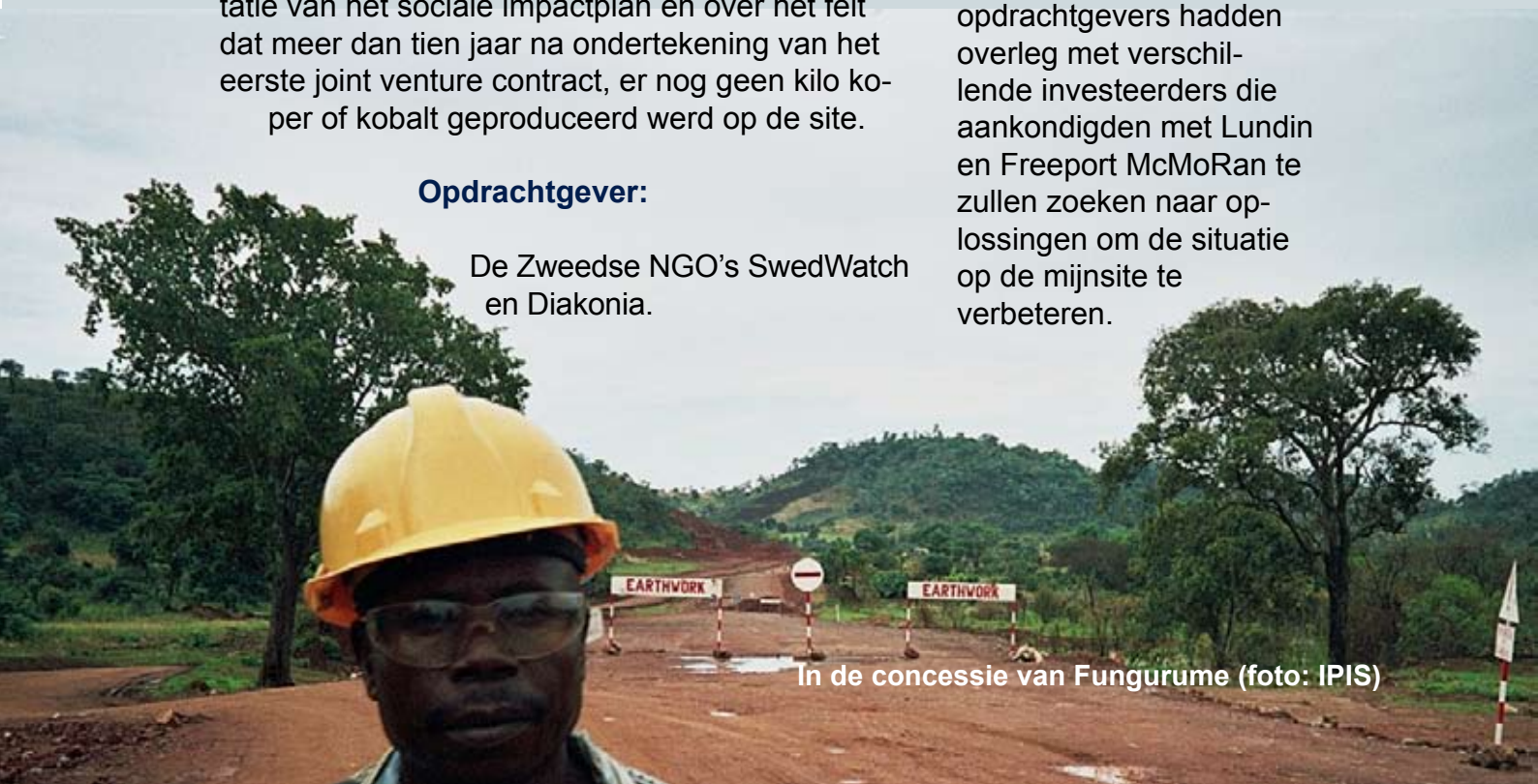
In de concessie van Fungurume

Het mijnbouwproject van Tenké Fungurumé heeft belangrijke Zweedse aandeelhouders, namelijk Lundin Mining en een aantal pensioenfondsen. Het rapport kreeg in Zweden dan ook heel wat media-aandacht. Onze opdrachtgevers hadden overleg met verschillende investeerders die aankondigden met Lundin en Freeport McMoRan te zullen zoeken naar oplossingen om de situatie op de mijnsite te verbeteren.