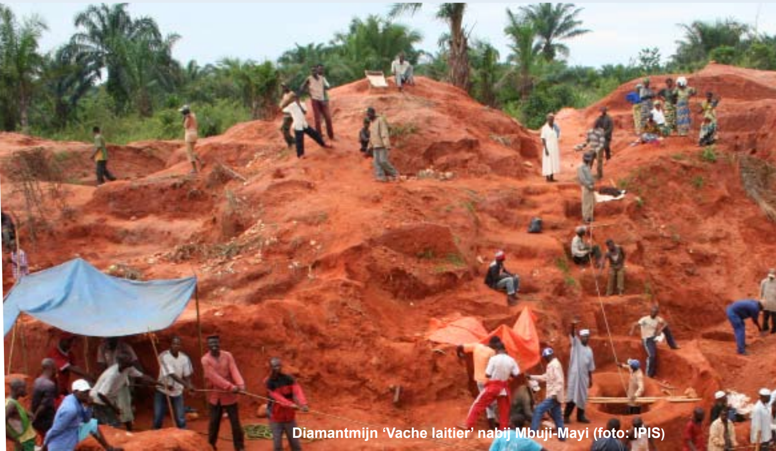
Diamantmijn 'Vache laitier' nabij Mbuji-Mayi

Spittaels Steven: In de kijker: Het Belgische beleid ten aanzien van de mijnbouwproblematiek in Congo in het licht van haar voorzitterschap van de Veiligheidsraad , Wereldbeeld: tijdschrift van de Vereniging voor de Verenigde Naties, jaargang 31, 2007/3, nr. 140, http://www.vvn.be/wereldbeeld/2007/